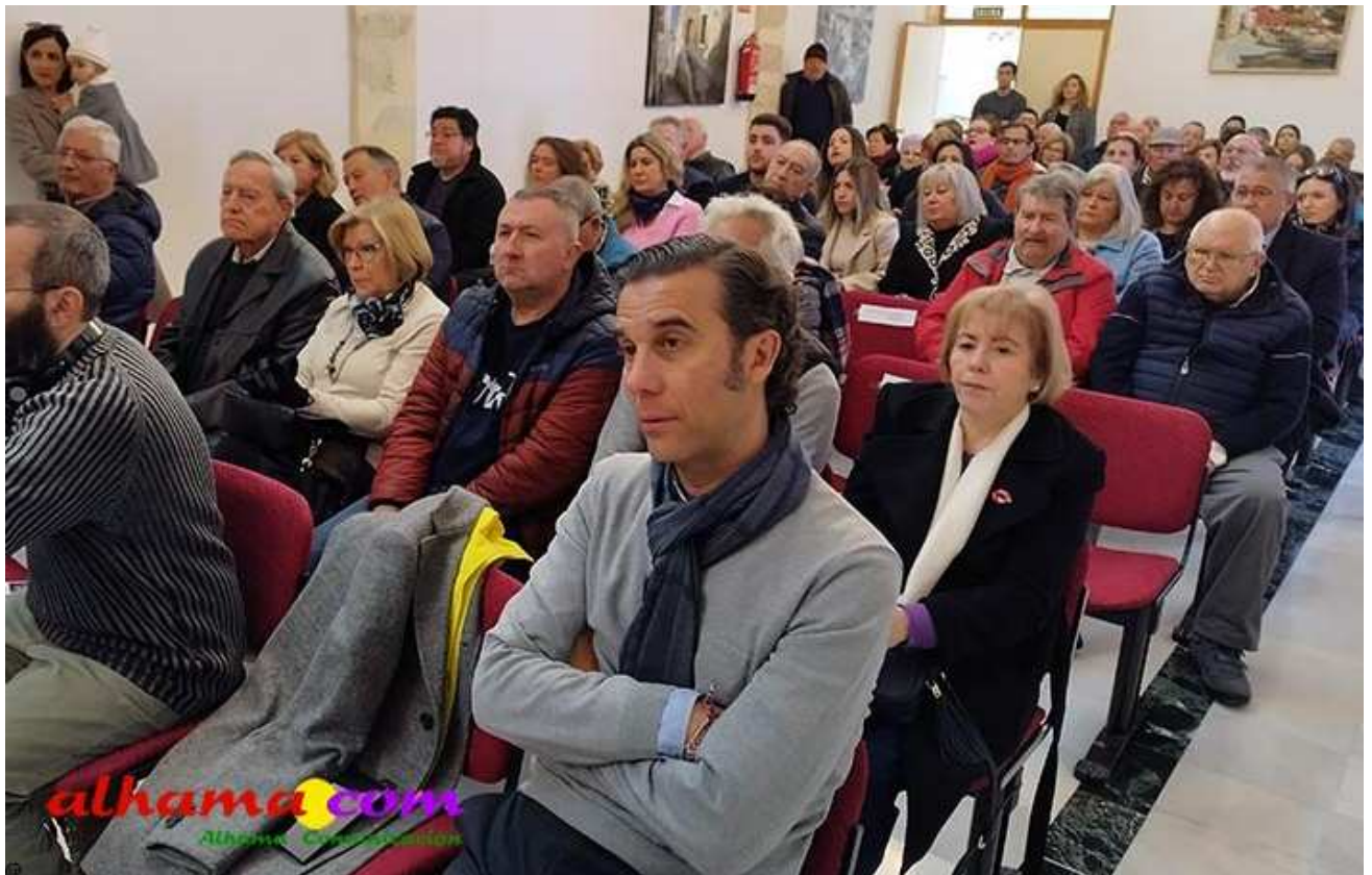
Aspecto del salón de actos

También estuvieron presente los representantes de la Junta Democrática de Málaga y Granada, los cuales agradecieron la invitación y manifestaron que se estaban abriendo delegaciones de esta asociación por todo el territorio nacional, por lo que era una satisfacción estar presentes en este homenaje.