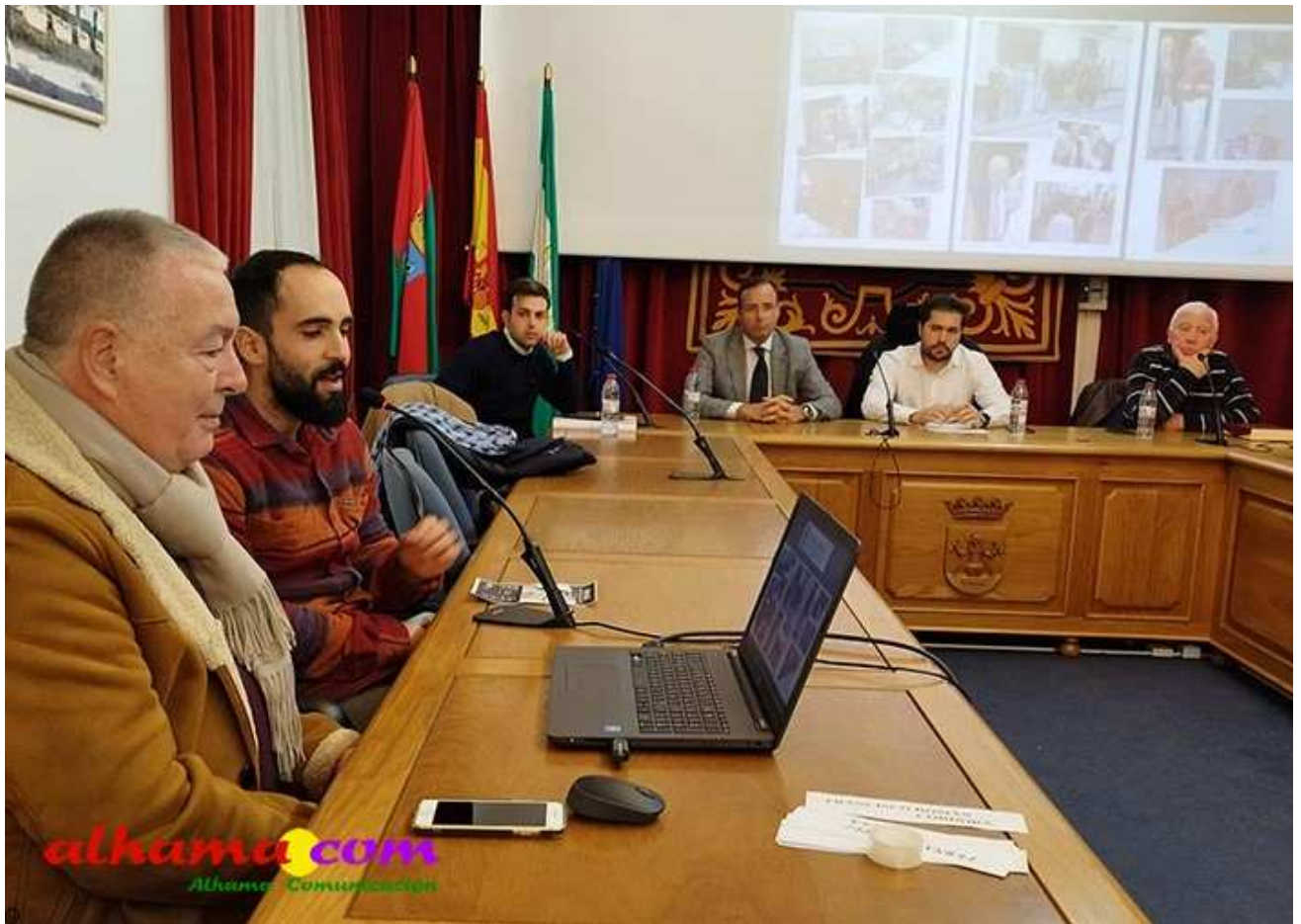
Representantes de la Junta Democrática de Málaga y Granada

También estuvieron presente los representantes de la Junta Democrática de Málaga y Granada, los cuales agradecieron la invitación y manifestaron que se estaban abriendo delegaciones de esta asociación por todo el territorio nacional, por lo que era una satisfacción estar presentes en este homenaje.