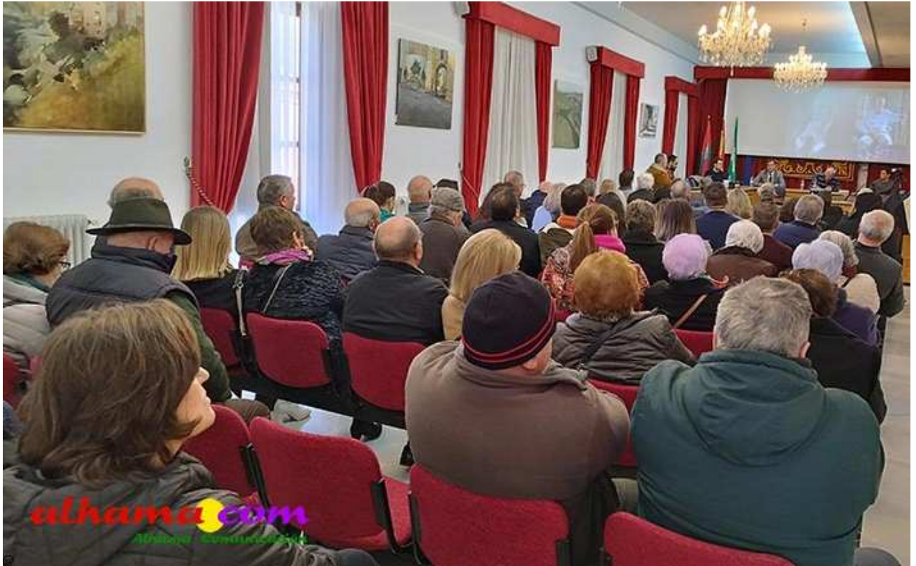
Seguimiento del acto