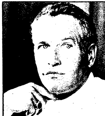
Paul Newman, protagonista de «Harper, investigador privado»