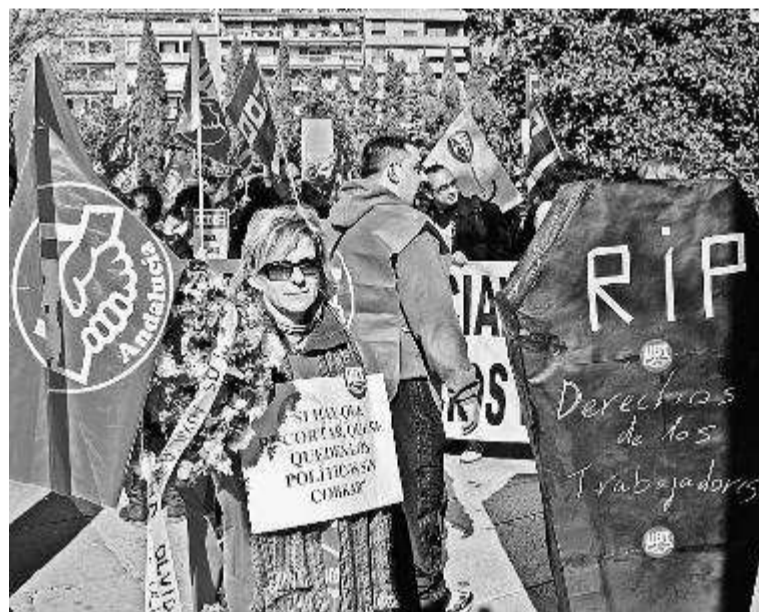
Protesta de los trabajadores de CLECE, la anterior concesionaria.

📺 Vea el vídeo de la concentración en ideal.es