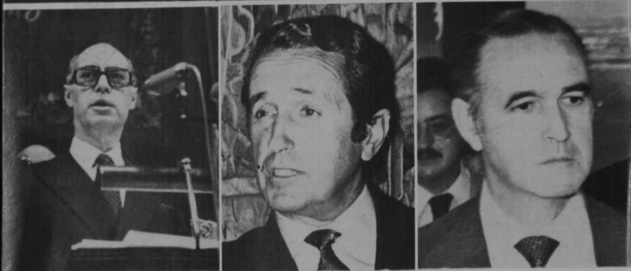
LOPEZ RODO, LOPEZ BRAVO Y LOPEZ DE LETONA Tres «lópezes» para un rumor.