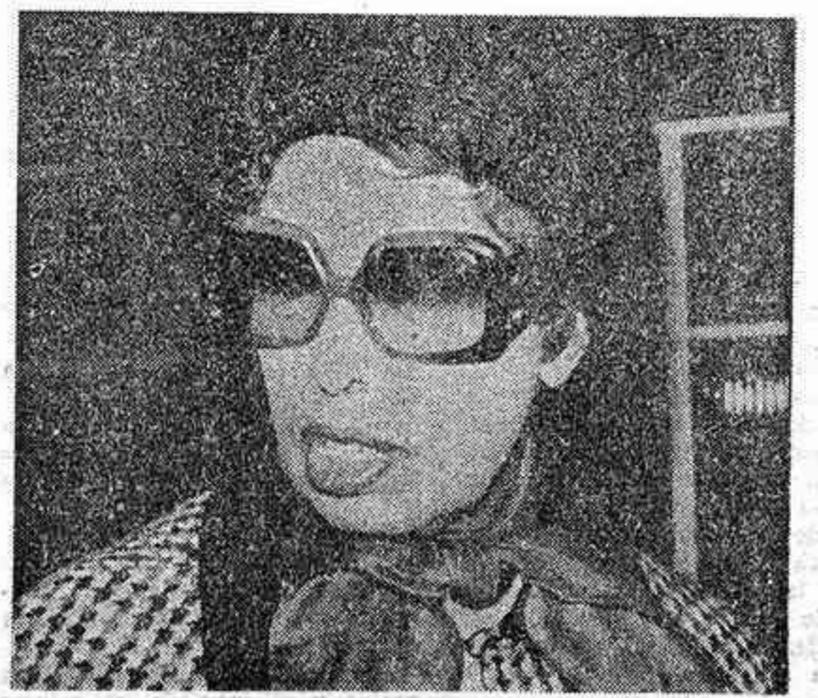
Información pág. 12