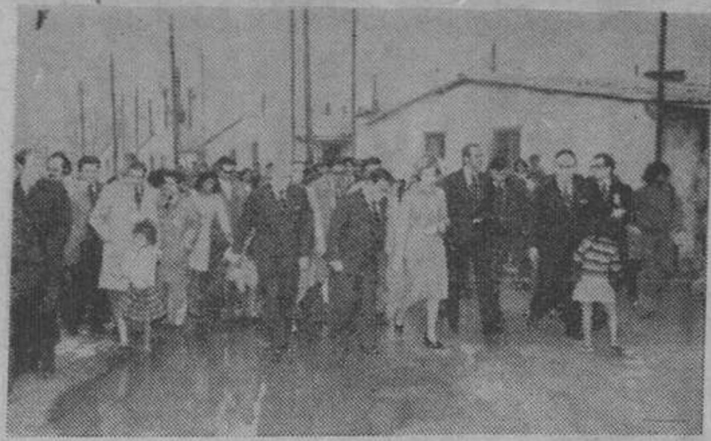
Los Príncipes de España, don Juan Carlos y doña Sofía han efectuado esta tarde una visita a diversos barrios de la ciudad. En la foto y pese a la inclemencia del tiempo, los Príncipes abandonaron el automóvil y a pie visitaron el barrio del Campo de la Bota.

El alcalde de Barcelona, don Enrique Masó, informó a los Príncipes de España sobre las