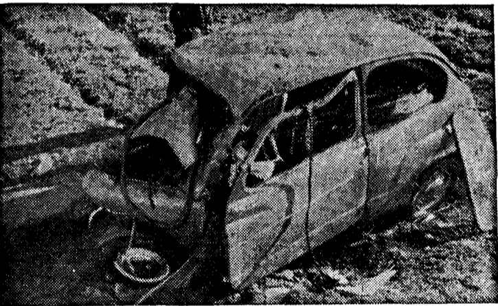
Impresionante aspecto que ofrecía el coche accidentado en el que hallaron la muerte dos jóvenes, cerca de Ordenes.

El suceso ha causado en Ordenes y su comarca general consternación.