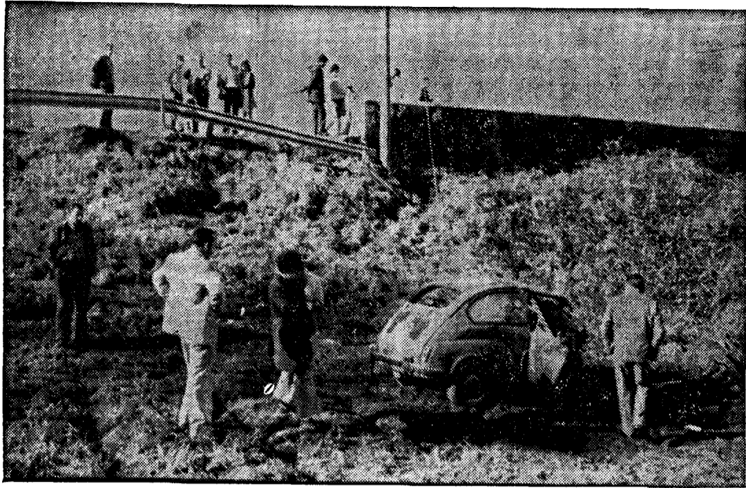
En el grabado se puede apreciar el desnivel por el que se precipitó el vehículo en el que viajaban cuatro jóvenes, resultando dos muertos y una joven con heridas de carácter muy grave. El percance ocurrió en la curva denominada Guindibó (Ordenes).