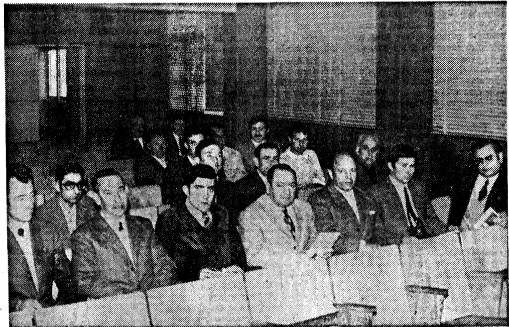
Asistentes al Cursillo durante el Acto de clausura

El Acto terminó con la entrega de los correspondientes diplomas, dando fin, por último, con un agradable ágape.