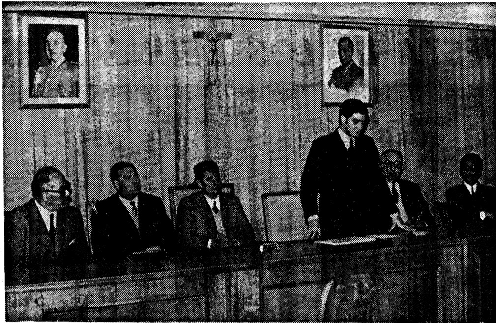
Presidencia del Acto de Clausura e intervención del Jefe del Gabinete Técnico

El 20 al 24 de Marzo y en la ciudad de Betanzos, se ha celebrado un Cursillo para formación de Vigilantes de Seguridad, organizado por la Mutua Gallega de Accidentes del Trabajo.