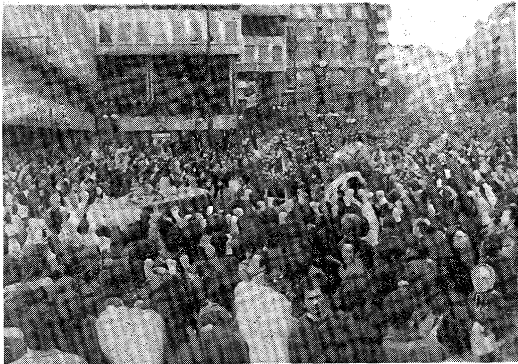
Una enorme multitud, congregada en las inmediaciones de la Plaza de Colón, al paso de la fúnebre comitiva.