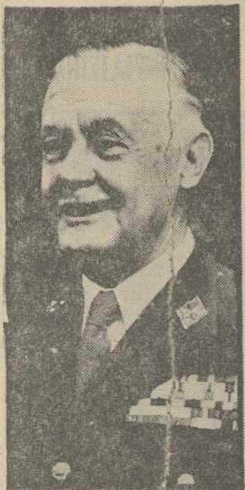
Don Fernando de Santiago

— "El cese se debe a insuperable discrepancia con otros miembros del Gobierno sobre la liquidación de la Organización Sindical"