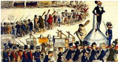
Caricatura del siglo XIX que ilustra el pucherazo electoral, algo muy habitual en las democracias liberales.

Y el hecho más notable, dentro de estas democracias liberales, es que los partidos políticos se constituyen como estructuras oligárquicas por definición, las cuales funcionan como máquinas de poder jerárquicas, burocráticas y autoperpetuantes, donde el liderazgo lo ejercen profesionales y la militancia se reduce a una función decorativa. Lo importante para el partido demoliberal es hacerse con cuotas de poder cada vez más amplias en el aparato estatal. No representan a los ciudadanos, si no a sí mismos y a quienes dirigen y orientan sus políticas, poderes espurios, vinculados a la alta finanza plutocrática. En última instancia, cuando su poder se consolida, absorben al Estado o son absorbidos por él, y se marcan como último objetivo la colonización de la administración, los recursos públicos y el imaginario colectivo. Esto último es, justamente, lo que está sucediendo en estos momentos con el gobierno de Pedro Sánchez, esbirro de la Agenda 2030 y la élite plutocrática global, con la conformación de redes clientelares y la colocación de representantes del PSOE en instituciones clave del régimen. Algo muy común en este tipo de regímenes, organizados en torno al bipartidismo, donde las alternancias se reducen a turnos entre élites internas, sin que haya posibilidad de ruptura ni apertura institucional.