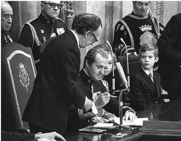
El rey de España, Juan Carlos I, en las Cortes firmando la Constitución recién aprobada un 27 de diciembre de 1978.

Bajo esta idea general, se elaboró el texto constitucional de 1978 , en el que se pretendía dar cabida a todas las «opciones políticas» y sensibilidades presentes en esta, nuestra piel de toro. Fue el famoso «café para todos», con la construcción de un estado asimétrico, fundado sobre las comunidades autónomas, que ya venían a desvertebrar la organización territorial de España y a convertirla en una amalgama de taifas con sus propios «reyezuelos» y gerifaltes integrados en el sistema de partidos, en la partitocracia, que ha sido y es el verdadero cáncer que nos asola y nos desnaturaliza desde finales de los 70, en una acción que se vio impulsada tras los reiterados fracasos de la UCD de Suárez y Calvo Sotelo , por el PSOE, una organización política nefasta y antiespañola desde sus mismos orígenes a partir de 1982, con el triunfo de Felipe González .