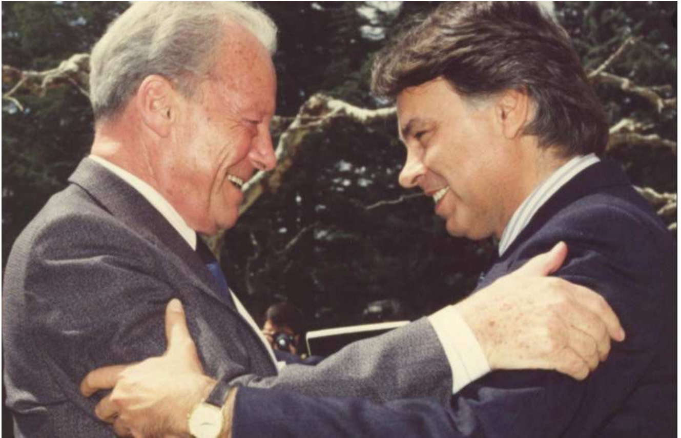
Willy Brandt y Felipe González durante uno de sus encuentros en los actos de la Internacional Socialista.

De hecho, las consecuencias del primer mandato del PSOE entre 1982 y 1986 fueron devastadoras, como ya hemos apuntado, en relación al tejido económico e industrial, con la consolidación de los oligopolios energéticos y la subordinación total en política exterior de España a la OTAN, la CEE y los Estados Unidos. Se creó a lo largo de estos años y los sucesivos una auténtica oligarquía política que se encargó de consolidar el modelo económico neoliberal y un aparato jurídico en coherencia con el primero, estrechando la sumisión y obediencia a las organizaciones pantalla, totalmente opacas, del globalismo tecnocrático. Algo que, por supuesto, podemos asociar tanto a la izquierda como a la derecha: en el caso del PP participa exactamente de los mismos círculos de poder, y contribuyendo a la consolidación de las destrucciones y reestructuraciones realizadas por Felipe González a lo largo de sus 14 años de gobierno.