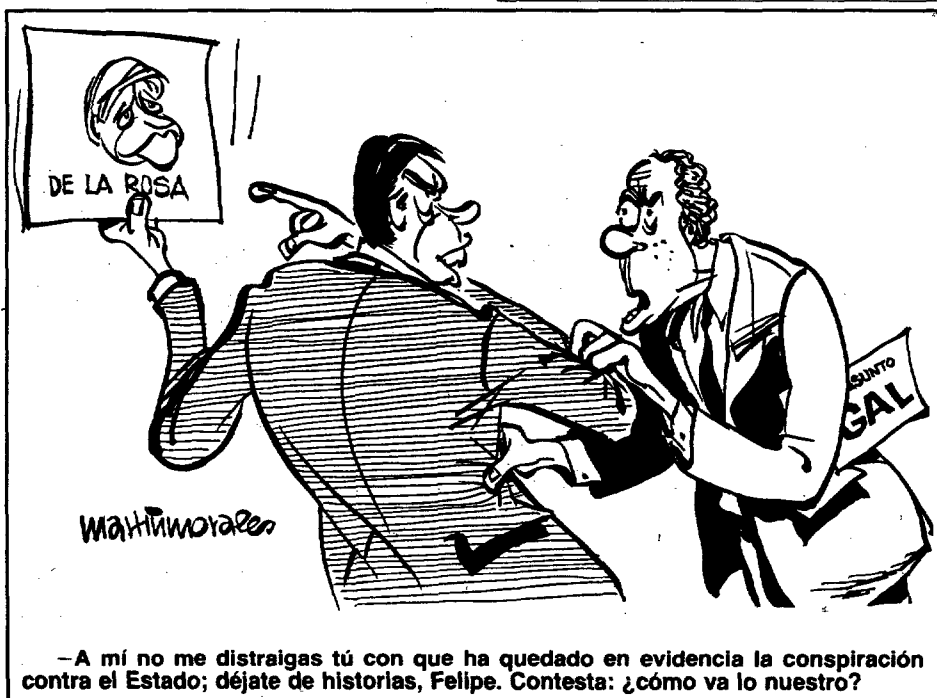
-A mí no me distraigas tú con que ha quedado en evidencia la conspiración contra el Estado; déjate de historias, Felipe. Contesta: ¿cómo va lo nuestro?

pero no sin desgaste para él y para las instituciones, en este caso para la citada comisión y para el Consejo General del Poder Judicial, cuya renovación, por cierto, está a punto de producirse pese al silencio reinante. En la comisión de conflictos estalló hace unos días una importante controversia, en la que Pascual Sala, su presidente, tuvo que soportar la crítica dura e inclemente de un Ruiz-Jarabo dispuesto a negar que exista conflicto de jurisdicciones en el caso de los papeles del CESID. La cólera de Sala no conoció límites cuando oyó que se le acusaba de propiciar un fraude de ley.