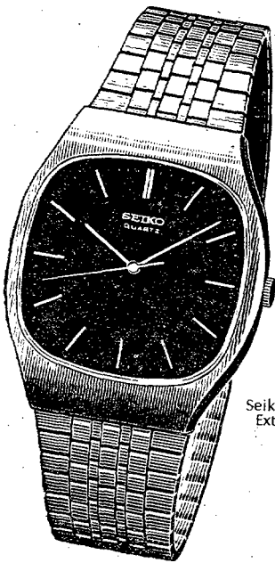
Seiko Quartz Extraplano