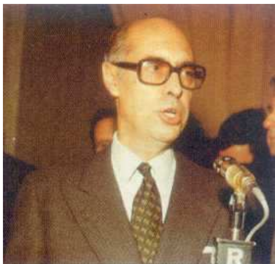
LLR, legislador en tiempos del Caudillo

Un buen día el nune mayor del Reino, LLR, llamó casi en secreto a FLM para elaborar un proyecto de leyes fundamentales que complementarían el sistema institucional.