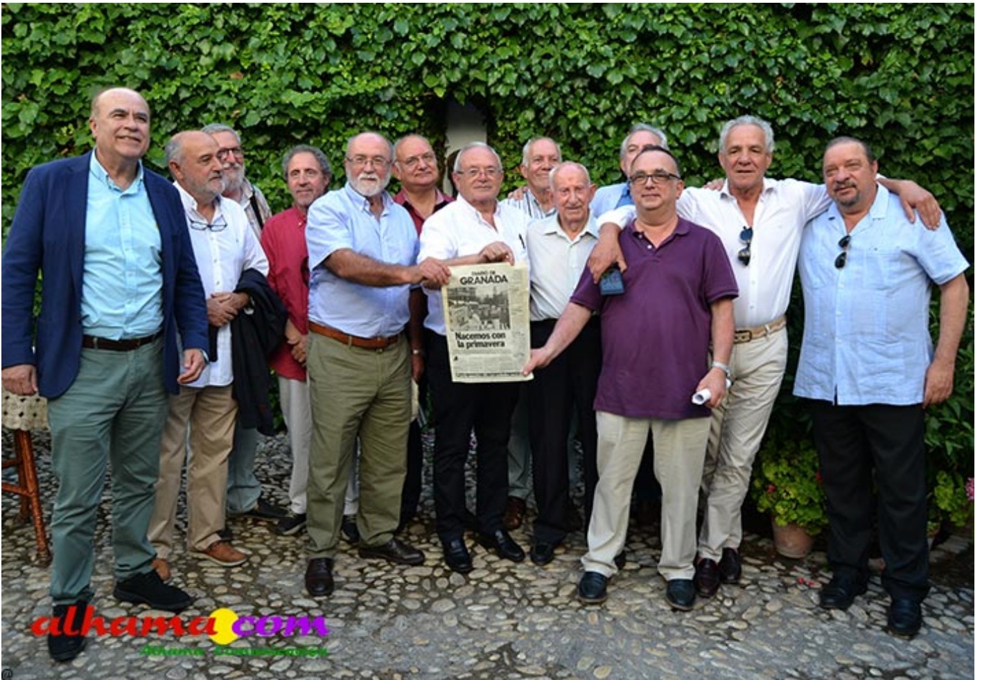
Con sus compañeros de los que fue El Diario de Granada, en 2019