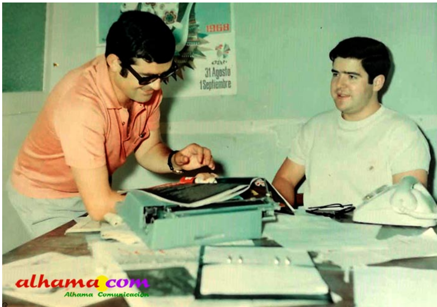
En el verano de 1968, en mi mesa de la redacción de "Sol de España" en Málaga

Necesitaba más horizontes que le imponía su forma de ver la esencia de un nuevo periodismo, participa decididamente en la creación de "Diario de Granada", en 1982, que lo dirige durante prácticamente durante los tres años de vida que tuvo. Le llaman para dirigir el diario "Córdoba", lo que hace durante trece años, con excelente acierto, para después marcharse a Sevilla para dirigir "El Correo de Andalucía", y aprovechar para preparar su doctorado y dar clases en la Universidad, lo que consigue y se convierte en inolvidable profesor de la Facultad de Ciencias de la Información de Sevilla con decenas y decenas de alumnos que jamás le han olvidado y se sienten muy orgullosos por haberle tenido como inigualable maestro en el auténtico periodismo.