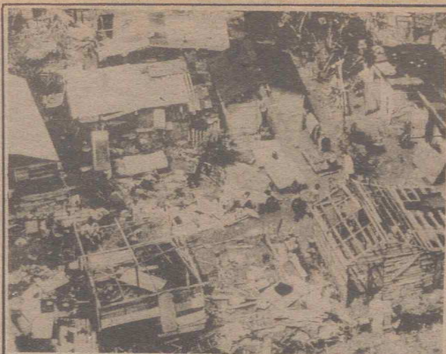
Al paso del ciclón "David"

MIÉRCOLES, 5 SEPTIEMBRE 1979 Precio: 20 PESETAS Año VIII - Núm. 2.938