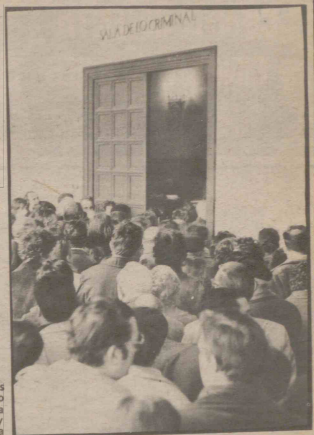
Centenares de vecinos de Las Fuentes han acudido al juicio esta mañana

LA AGRUPACION ARTISTICA aragonesa lleva recaudadas unas trescientas mil pesetas en dinero y material para ayudar a Guatemala tras los terremotos sufridos. Asimismo se han abierto cuentas y centros de recepción de ayudas en otros centros zaragozanos; en uno de ellos, el Hogar Extremeño, iban recaudadas quince mil pesetas en la mañana de ayer, entre sus socios.