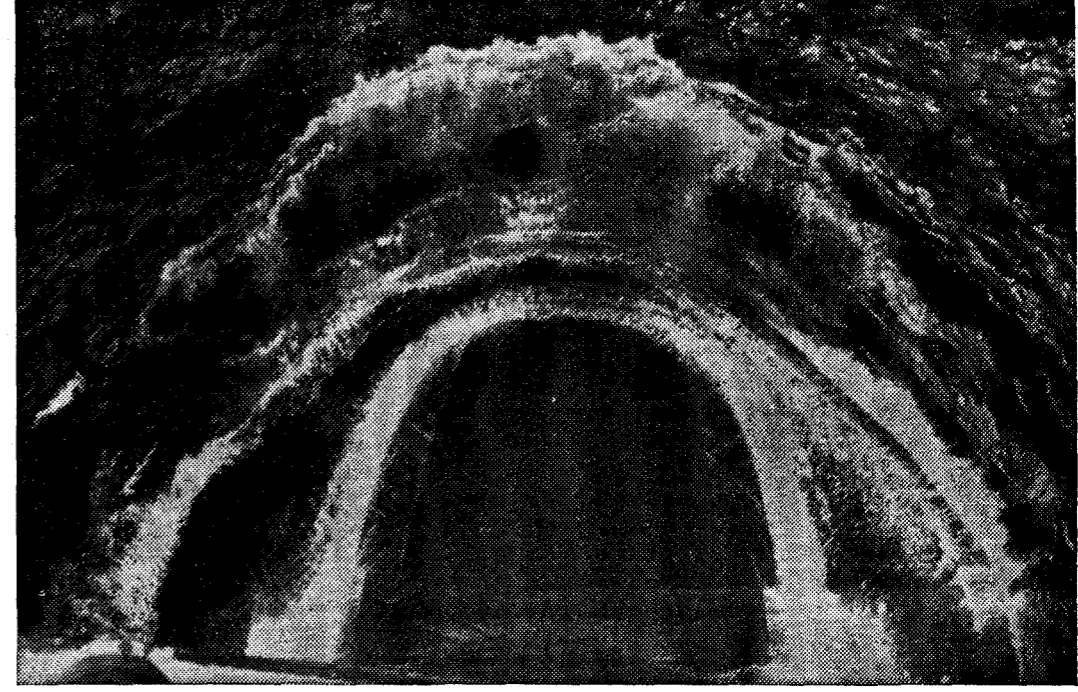
Impresionante aspecto del bulbo de proa del «Alvaro de Bazán», surcando las aguas, durante las pruebas realizadas ayer.

Fue entregado el superpetrolero «Alvaro de Bazán» Realizó las pruebas oficiales entre Prior y Prioriño Hoy llega el «Atlanta» con un cargamento de pieles