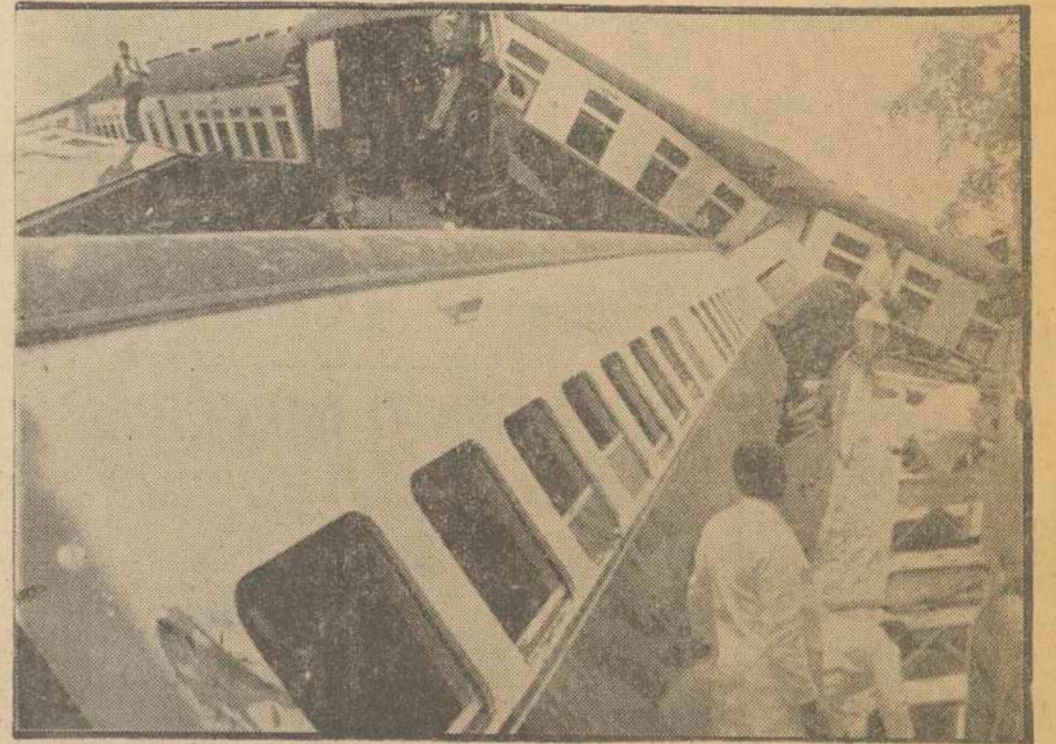
A causa de las inundaciones que últimamente ha tenido que sufrir Kenia, el tren nocturno que une Mombasa con Nairobi desarró, cayendo la mayor parte de los vagones en un río inmediato. Las primeras informaciones hablaban de centenares de muertos, como hacía temer esta estampa sobrecogedora, pero, como ya hemos informado a nuestros lectores, no fue tan grave como al principio se supuso. Sin embargo la lista definitiva no podrá hacerse hasta que terminen los trabajos de rescate de víctimas entre las unidades destruidas.