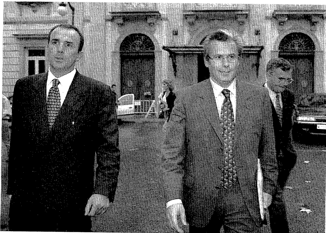
El juez de la Audiencia Nacional, Baltasar Garzón, tras prestar declaración en el Supremo

Polanco se querrela contra el instructor del caso Sogecable por prevaricación