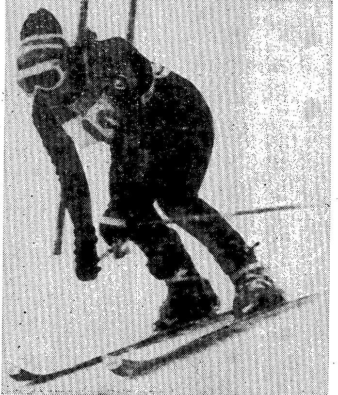
La suiza M.ª Therese Nadig está copando las más importantes pruebas de esquí en Sapporo. Tras su victoria en el descenso, ayer ganó la de slalom gigante. En la telefoto de "Europa Press" la vemos en un momento de su intervención.