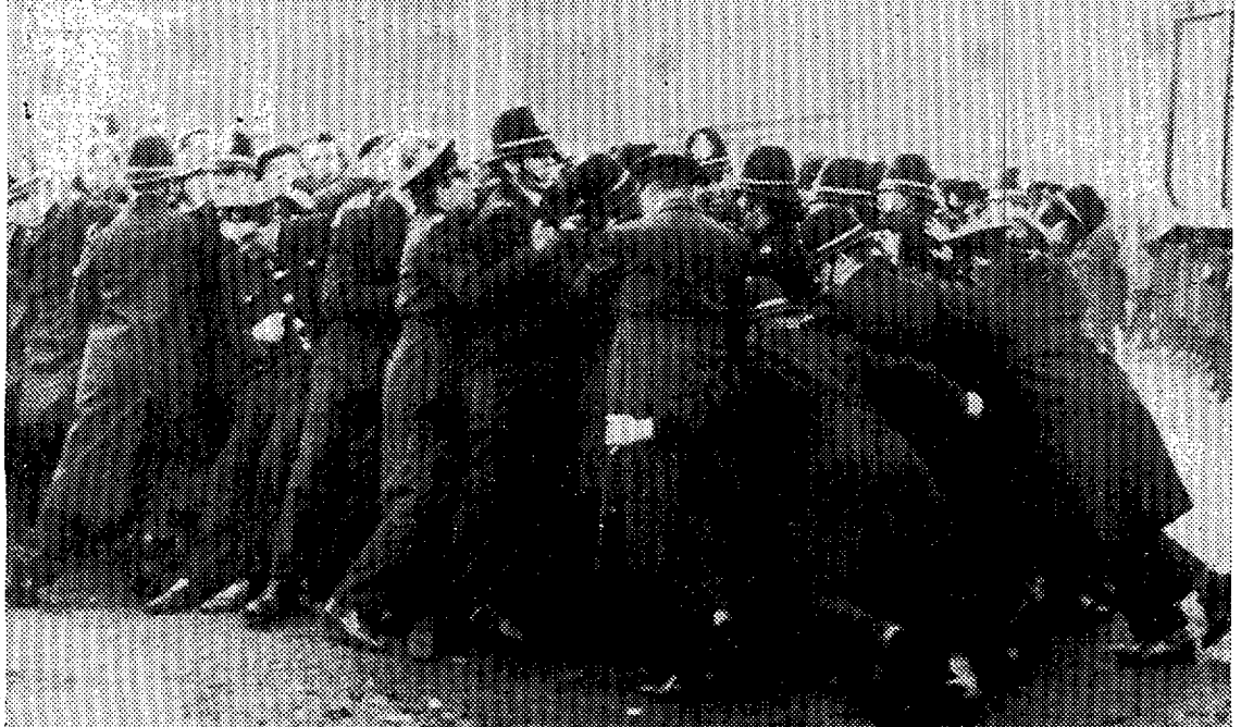
BIRMINGHAM. -- Dos policías y dos mineros han resultado heridos en los choques registrados ayer frente a los grandes depósitos de carbón de esta ciudad. En los últimos días, piquetes de mineros intentan impedir por todos los medios el suministro de carbón de dichos depósitos con destino a diversas centrales térmicas.

El Gobierno intentará hacer frente a la huelga de mineros