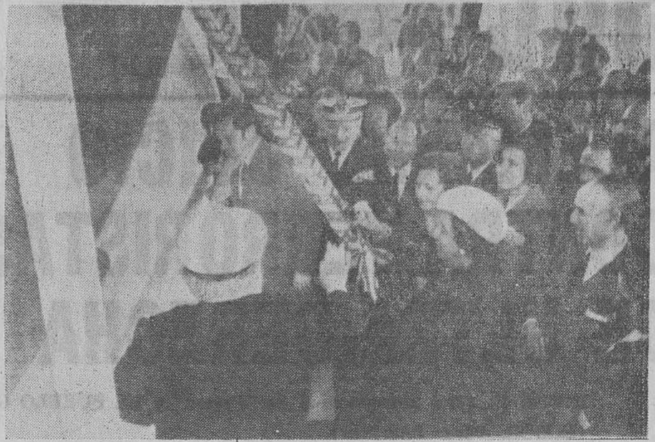
FUE MADRINA DOÑA CARMEN POLO DE FRANCO

A continuación se examinaron los diversos puntos creados en el orden del día, entre los cuales figuraban, como temas más importantes, las previsiones de alumnado en las Universidades para el curso próximo.