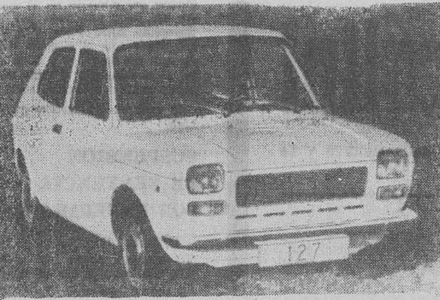
MADRID.—El 127, que Seat se dispone a presentar en los próximos días en Canarias, continúa obteniendo el aplauso de la crítica europea en su versión Fiat.

El señor Kaalman dijo a los informadores, momentos después de su llegada, que estaba muy contento de venir a nuestro país, con el fin de conocer más profundamente la agricultura española y hablar de los problemas comunes.