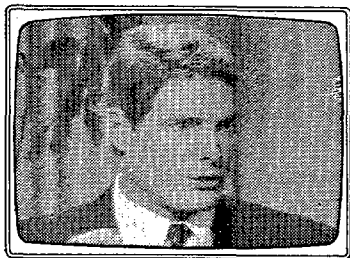
«Primero izquierda» (TVE-1)

Al asesino del carnicero el muerto le sale gratis, y así lo dijo en directo y por teléfono desde la cárcel de Alcalá-Meco. Margarita Landi no se corta y destapa todos los rincones de sus crímenes favoritos, eso sí, tan reales como la vida misma.