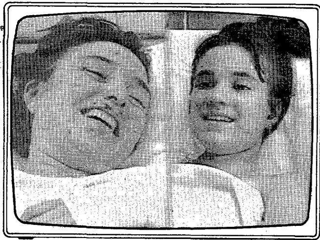
«De tú a tú» (A 3 TV)