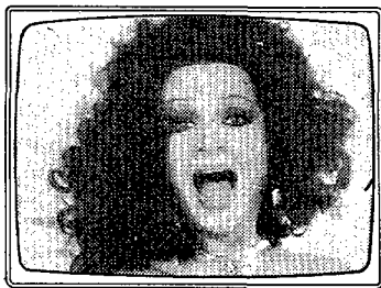
«La movida» (Galavisión)

baja donde podrán recuperar, por lo menos, la movilidad. Existen algunas cruzadas que además de necesarias ayudan a limpiar las conciencias de quienes se niegan a admitir los dramas ajenos: A la atención de la señora Matilde Fernández, porque de oído carece.