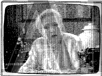
«Mis crímenes favoritos» (TM 3)

Los invitados—sorpresa de Verónica Castro en su programa «La movida» son cada vez de mayor calibre. Sara Montiel, con una actuación de las que hacen época, ha puesto, sin saberlo, en un aprieto al programa de Galavisión: superarla.