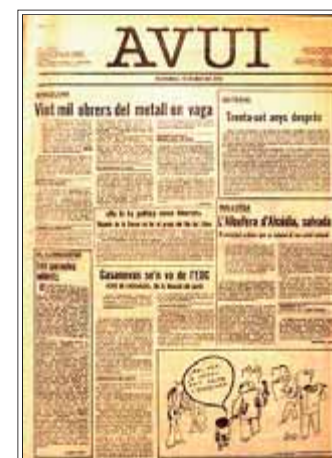
Primera portada de l'Avui

23.04.1976. Publicació del primer número de l'Avui.