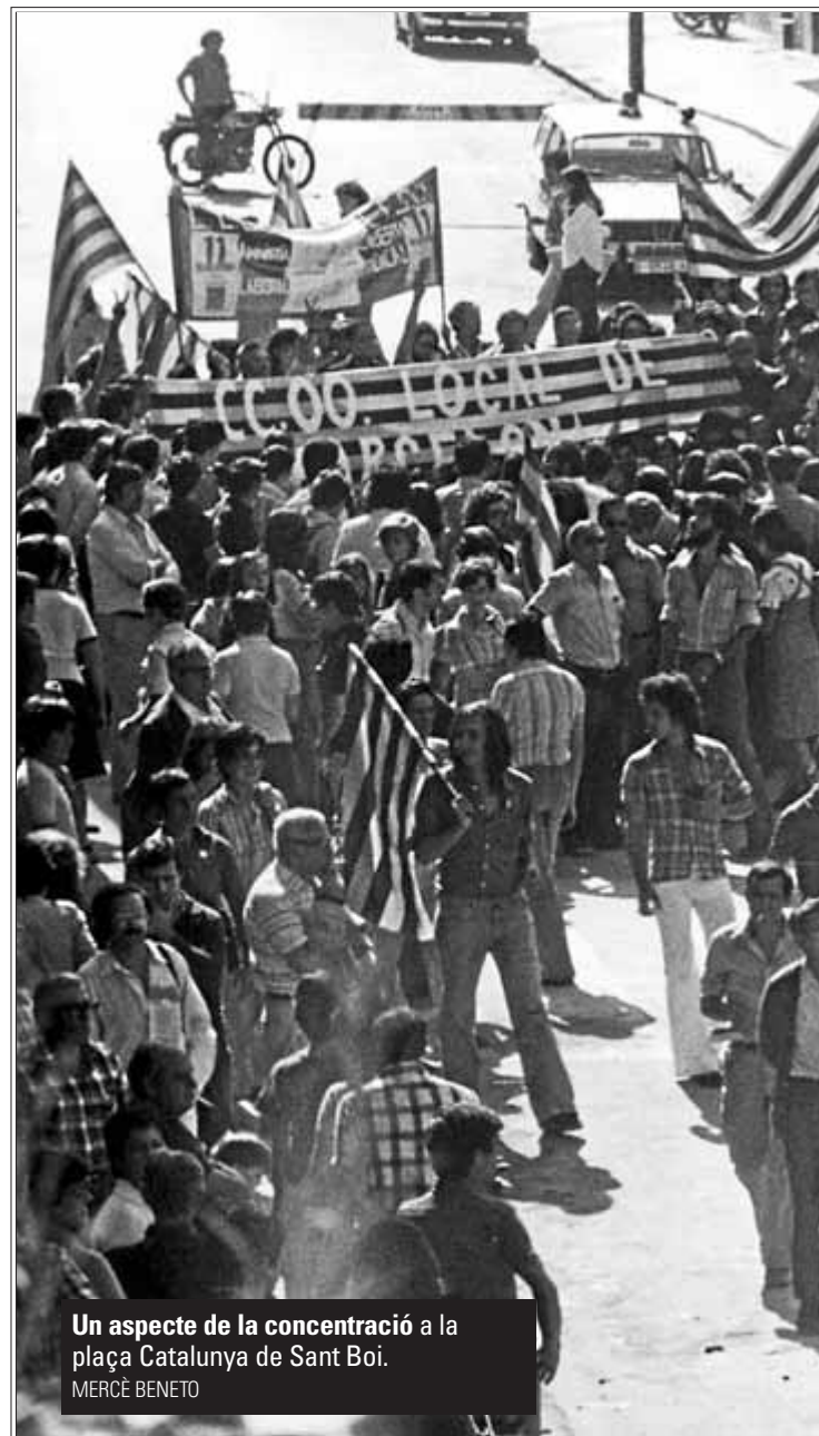
Un aspecte de la concentració a la plaça Catalunya de Sant Boi. MERCÈ BENETO

Que aquella concentració era insòlita, en dona fe el nombre de periodistes que s'hi van acreditar: 160, dels quals 100 eren