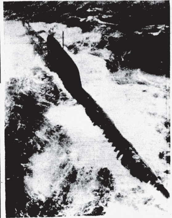
LONDRES. — Vista aérea del submarino nuclear soviético, al parecer en apuros debido a una avería, que fue descubierto por un caza de la RAF en el Atlántico Norte, 600 millas al noreste de Terranova.