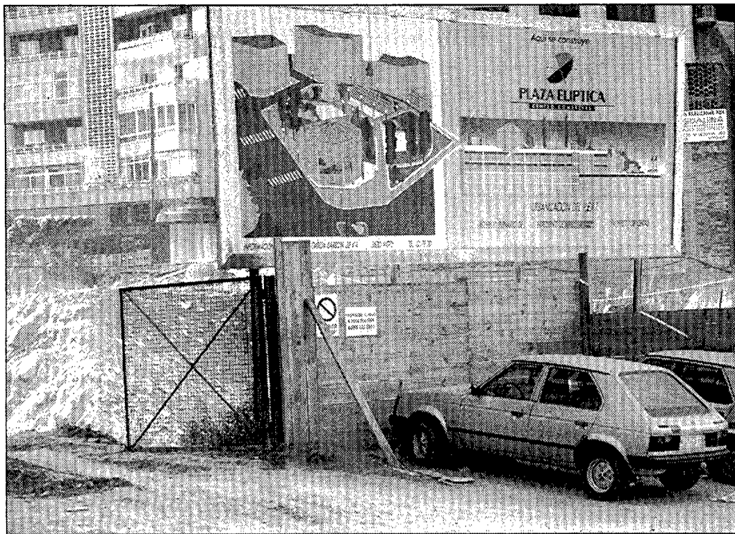
La plaza Elíptica será para el ilustre vigués de Lorenzana