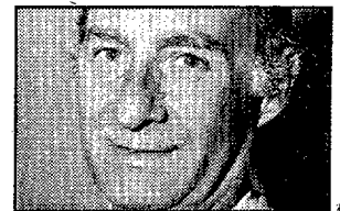
Alfredo Mayo en «La caza»