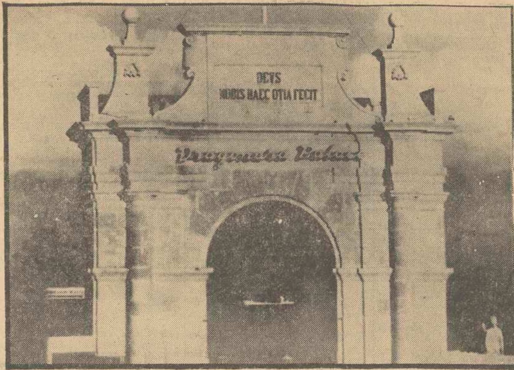
A lo largo de la costa del Mediterráneo funcionan numerosos casinos. En la foto, la singular entrada del de Malta, con un lema tomado de Virgilio: "Dios nos proveyó de este placer".

Un consejo: si usted quiere jugar a la lotería, cómprela pronto en las expenditorias oficiales. En otro caso, tendrá en ocasiones que acudir a los revendedores, con el diez por ciento de prima sobre el precio del billete. Esto es perfectamente normal y está autorizado o, al menos, consentido. La lotería le sale al paso por todas partes, en el bar, en el cine, a la vuelta de la esquina. Esto no quiere decir que no se venda; por el contrario, cada día se vende más lotería. Esa compra, al menos, viene a dar unas ilusiones cuyo precio es inestimable. Y, muchas veces, al jugador habitual, dinero, beneficios. No existe—aunque hay varios libros sobre el tema—, ninguna fórmula mágica para ganar, pero muchas veces se gana, poco o mucho. De la puerilidad, exactitud y recitad con que se realizan los sorteos en la lotería española, todos se hacen lenguas, nunca se dieron casos de