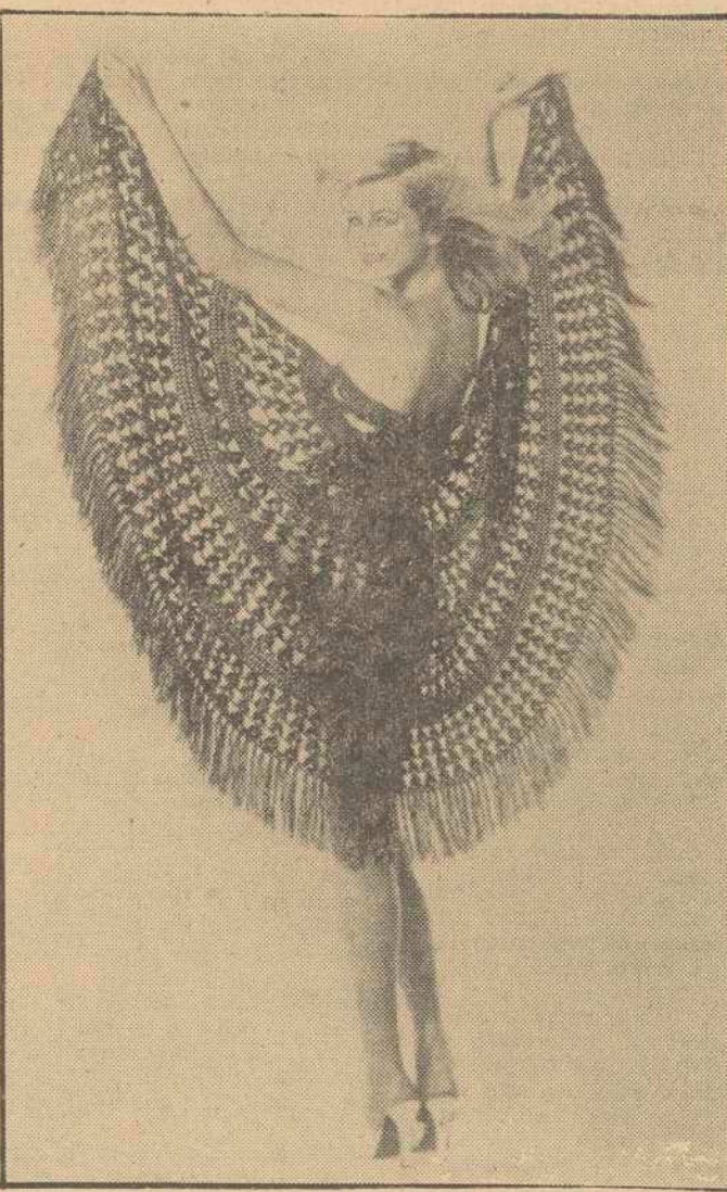
Este precioso chal "tela de araña" fue diseñado por un modisto inglés que asegura que queda tan lucido con un traje de noche como con unos "vaqueros". En la foto, detrás de los flecos, vemos un modelo que nos demuestra como un traje de Eva resulta también muy aparente.