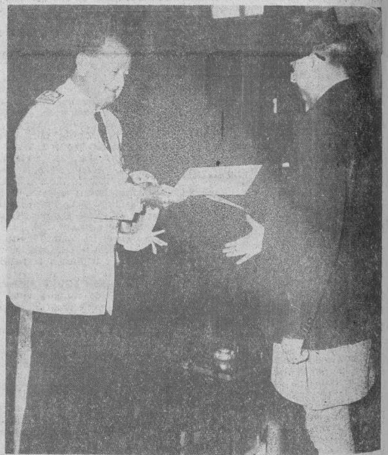
Esta fotografía recoge el momento en que don Miguel Teus, nombrado embajador de España en el Reino de Nepal, hace la presentación de sus cartas credenciales al rey Mahendra, en el Palacio Real de Katmandu. Es digno de observarse la curiosa indumentaria del soberano.