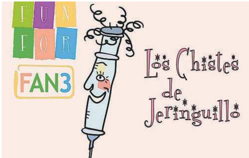
«Los chistes de Jeringuillo», el personaje animado más popular de este canal de televisión

La señal de FAN 3 llega ya por satélite y en circuito cerrado a 35 hospitales de ocho Comunidades