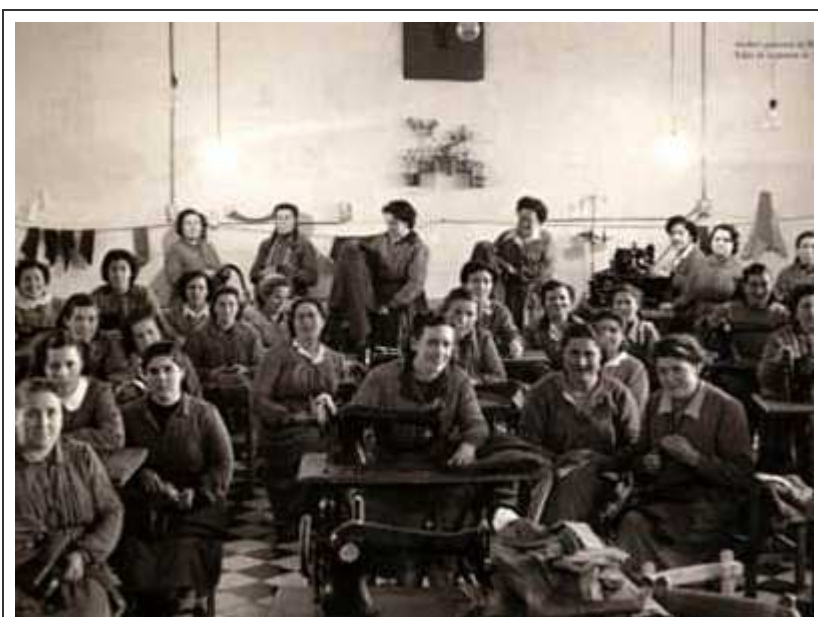
Cárcel de mujeres en la posguerra española

de Franco. Lo realmente trágico para esta democracia es que tampoco la hubo cuando murió el dictador y los que habían medrado a su sombra siguieron en el puesto. Tal vez cambiaron el traje, pero sin renunciar ni pedir perdón ni por supuesto dejar paso a otras gentes. Fraga es un ejemplo de ello. En la hora de su muerte, todo el mundo parece haber olvidado que este señor fue ministro en la dictadura. Fundador del partido que hoy nos gobierna y presidente de honor del mismo hasta el último momento.