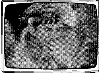
«Resumen deportivo» (La 2)