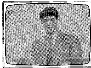
«En acción» (TM 3)

Con la misma estructura de «Regreso al futuro», la factoría «Hanna-Barbera» ha enviado a tres personajes de reconocimiento por la Biblia. En dibujos animados, muy por debajo del guión, los niños acceden a unas Sagradas Escrituras renovadas y con un fuerte y adecuado sabor a aventura.