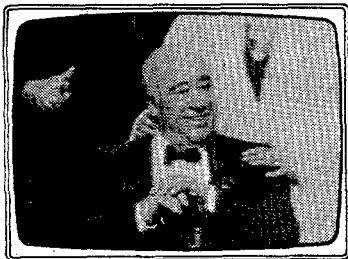
«Primero izquierda» (TVE-1)