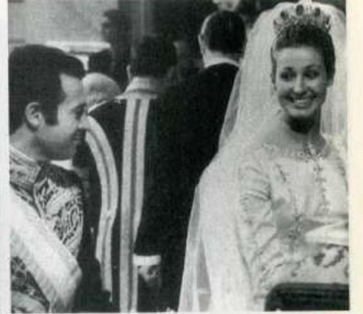
Alfonso de Borbón Dampierre fue siempre desleal a Don Juan. Jugó abiertamente a ser nombrado sucesor por Franco contra su primo Don Juan Carlos y, designado éste, continuó, tras su boda (en la imagen) con la nieta del generalísimo, intrigando para que el dictador rectificara. Era hijo del Infante Don Jaime, sordomudo, que renunció a sus derechos dos años antes de casarse, cuando no había perjuicio de terceros. Alfonso de Borbón Dampierre nació, pues, sin derechos. Su madre era la bella Manuela Dampierre, en la foto con sus dos hijos, Alfonso y Gonzalo, niños.