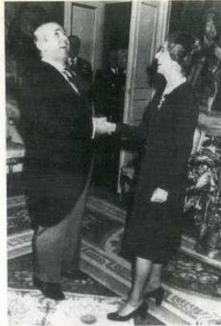
Arias Navarro, antimonárquico, antijuan-carlista, hombre de confianza de la familia del caudillo, fue elegido presidente del Gobierno tras el asesinato de Carrero. Franco estaba decepcionado por la actitud de Don Juan Carlos y, en lugar de nombrar a Fernández-Miranda, que era el hombre de confianza del Príncipe, designó a Arias. El nuevo presidente liquidó en unas semanas a los más estrechos colaboradores del Príncipe, entre ellos a López Rodó. En la imagen rie junto a su valedora, la esposa del dictador, a los pocos días del asesinato de Carrero.