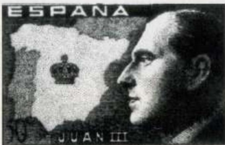
Este sello que infinidad de españoles pegaba en los sobres de correspondencia irritaba especialmente a Franco.

Pregunta. Monseñor parece sentir que la aspiración más funda del pueblo español es la del cambio del sistema autoritario al democrático. ¿Será posible este cambio sin graves alteraciones de la paz pública? Respuesta. Yo pienso llevar a cabo este cambio sin riesgos para la comunidad española. Es lo que desea la inmensa mayoría. Pero sectores minoritarios de signo opuesto, y por motivaciones radicalmente distintas, quieren impedir la transformación del régimen (actual) en un Estado democrático moderno. Los extremos convergen para bloquear con su acción el tránsito pacífico a la libertad y a la democracia. Con una diferencia: la ultra-derecha, la única que hoy defiende ideológicamente el régimen, se utiliza por éste como pretexto para frenar esa gran mayoría que desea el paso a la democracia. Para desbloquear esta situación de ignorancia, que beneficia sólo a la clase política corrupta, y a los medios de negocios que se alimentan de ella por la corrupción, es un deber nacional ofrecer una solución política que garantice, como alternativa realista y realista, los legítimos intereses y los valores morales considerados como esenciales tanto