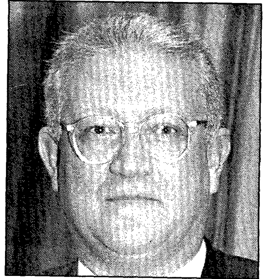
J. J. Armas Marcelo