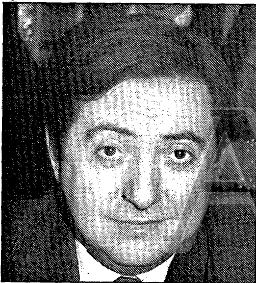
Federico Jiménez Losantos