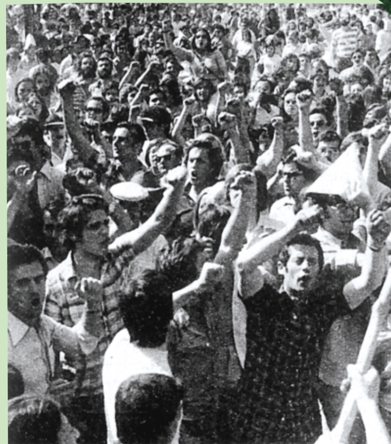
'Fiesta de la Libertad' en Fuentevaqueros, el 5 de junio de 1976 a las 5 de la tarde. La memoria de Lorca se hermana con la nueva democracia.

LA RECUPERACIÓN DE LA LIBERTADES FUE UNA AVENTURA DE TODOS, UNA EMPRESA COLECTIVA EN LA QUE PARTICIPARON AQUELLA ESPAÑA SILENCIOSA, NO OFICIAL QUE, PARA EL CASO PARTICULAR DE GRANADA, VENÍA PREPARANDO DURANTE DECENIOS UN LUGAR DE REENCUENTRO. FUE UN LUGAR PARA LA RECONCILIACIÓN PREÑADO DE NOMBRES Y APELLIDOS QUE MERECE QUEDAR EN LA MEMORIA DE NUESTRO PASADO RECIENTE EN HOMENAJE MERECIDO A CUANTO HUBO DE GENEROSA ENTREGA -LA LUCHA POR LA DEMOCRACIA EN CLANDESTINIDAD PESE AL RIGOR DE LA REPRESIÓN FRANQUISTA- Y CUANTO HUBO DE GENEROSA COMPRENSIÓN EN TANTOS HOMBRES Y MUJERES QUE PROCEDENTES DEL FRANQUISMO SOCIOLÓGICO, SIN EMBARGO, SE PROPUSIERON Y LOGRARON TRABAJAR POR LA PAZ Y LA CONVIVENCIA.