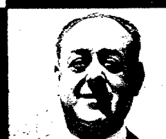
Marqués de la Florida