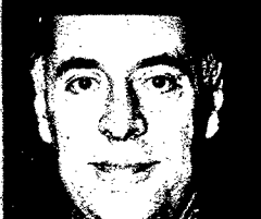
Laureano López Rodó