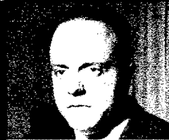
Manuel Fraga Iribarne