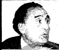
Joaquín Ruiz Giménez