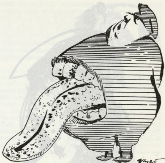
(Vasco. Cuadernos de Ruedo ibérico.)

« Los periódicos madrileños critican la arbitraria suspensión de Madrid ». Este es el título que a tres columnas encabeza en Le Monde la crónica de su corresponsal J.A. Novais. Dice que el jurado de empresa de Madrid ha redactado una nota, dirigida al personal, sobre los alegatos del Director general de Prensa suspendiendo la publicación del periódico: la suspensión la ha dispuesto el gobierno y la causa « oficial » son los « errores administrativos »; la reanudación puede tener lugar pero a base de que el Director general de Prensa apruebe el nombramiento del director del periódico y de « que el Comité negocie con la empresa y ésta firme acuerdo de conceder la explotación económica y técnica a terceras personas ». [OPE, 30-11-1971.]