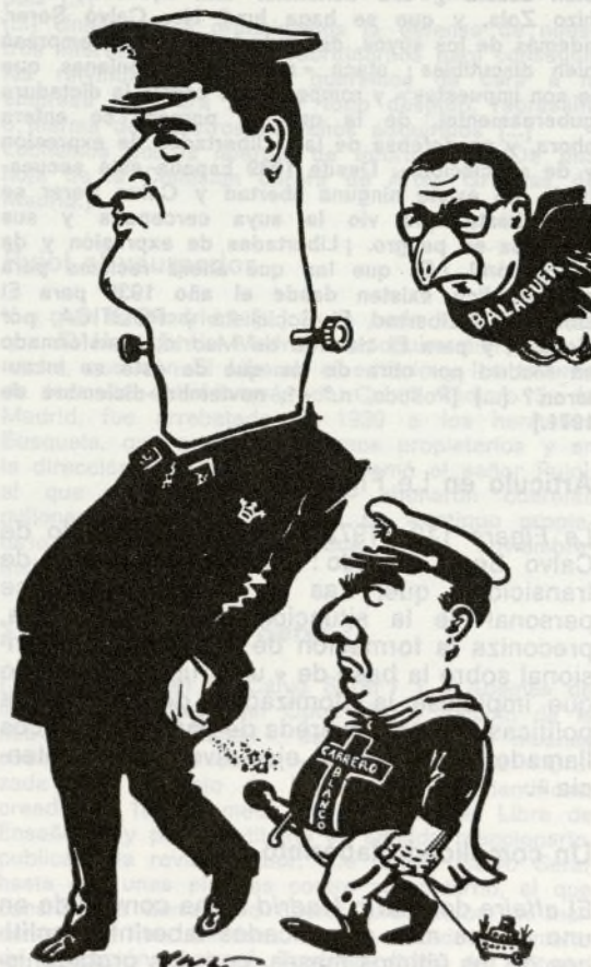
(Vasco. Cuadernos de Ruedo ibérico.)

no a un periódico libre sino a un Madrid propiedad de un grupo político-económico conservador que ha entrado en conflicto con el equipo gobernante. ¿Que en ese Madrid se exponían opiniones críticas y la verdad informativa asomaba con cierta frecuencia la oreja? El mérito corresponde, en nuestra opinión, a la creciente pugna de periodistas que no aceptan el papel del «mundo del serrallo». Y en la continuidad de esa pugna confiamos. [...] Nosotros apreciamos muchísimo la amplia solidaridad profesional a que ha dado lugar la cuestión del diario Madrid. Es no sólo, una expresión de conciencia sino fundamentalmente, de dignidad en el gremio; también lo es de conciencia política. Porque, en definitiva, lo que estaba y está en discusión es el derecho de los periodistas —y del país— a la Libertad de prensa. [...] [Mundo Obrero, 18-2-1972.]