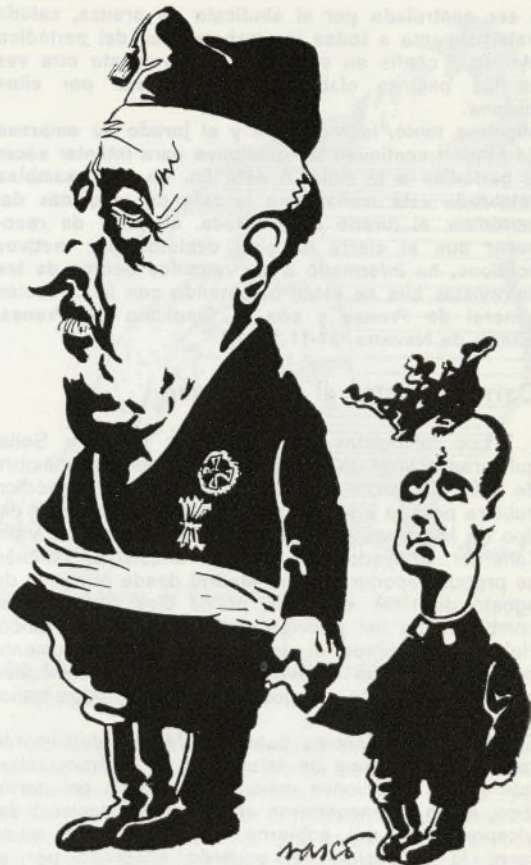
(Vasco. Cuadernos de Ruedo ibérico.)

«Consternación» es el término exacto que el cierre del diario Madrid ha producido en los medios políticos y periodísticos. Hoy toda la prensa se hace amplio eco de la medida dictada por el Ministerio de Información y Turismo contra el periódico, al tiempo que algunos editoriales analizan la medida