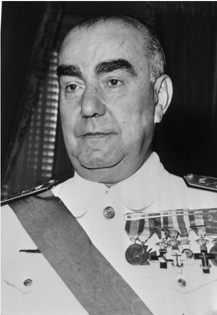
almirante Carrero Blanco

Suárez hombre de extrema derecha iba a misa para que Carrero lo viera, para "hacer carrera" Nunca he ido a misa para hacer carrera. A mucha honra. Son excepciones: Estando en el Opus lo suyo. es rezar el rosario para hacer carrera. "Para que te vean y premien tu piedad". Palmadita de ascenso.