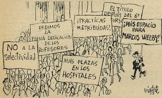
«Siempre me han apasionado los problemas de la Medicina!»

Tras la decisión de que no entrará en vigor la suspensión de materias dictada contra algunos cursos de la Facultad de Medicina de la Universidad Complutense, parece que la situación estudiantil va a tender hacia una normalización, aunque las reivindicaciones de tipo académico que iniciaron la crisis están todavía por conceder.