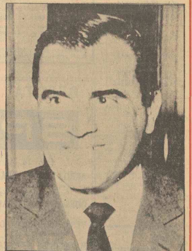
JUAN MARIA BORDABERRY