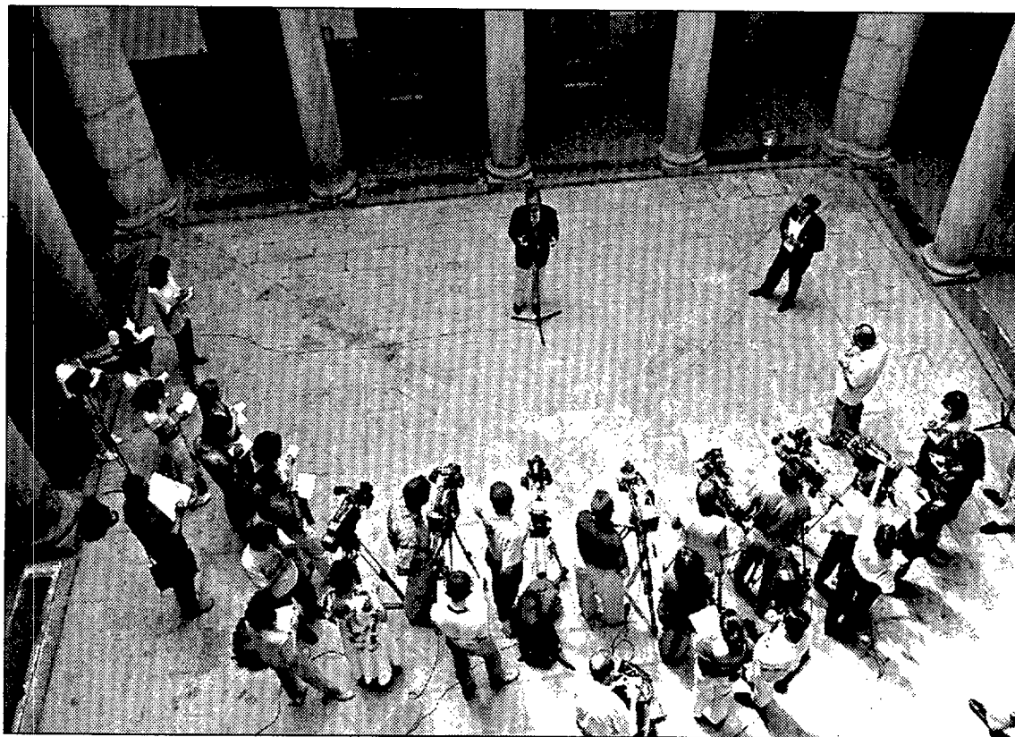
Javier Solana, rodeado de informadores, durante la rueda de prensa ofrecida ayer por la mañana.