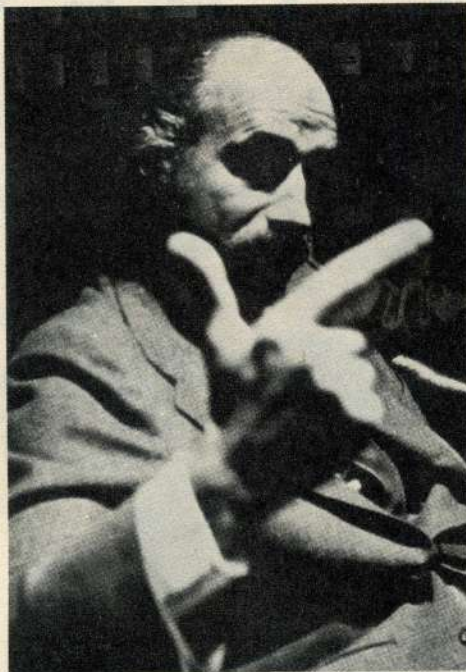
«Me ataca la coalición gobierno, PSOE, Alianza Popular.»

—¿Cuál es entonces la fuerza de izquierda importante en España?