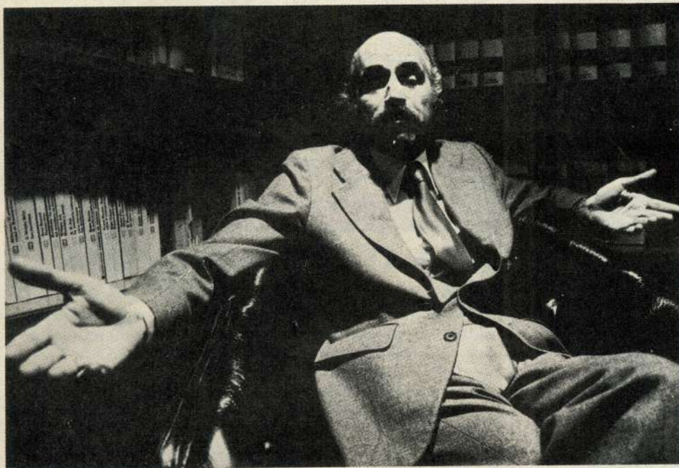
«Me acabo de pegar el porrazo ahora, ¿y qué?»

—Sí, sí, sí. Aunque la mayoría son de ideología socialista. Pero también hay mucho demócrata radical, que son lo que hoy sería Azaña. Este grupo abunda entre los catedráticos de universidad. Yo no. Yo soy dialéctico y por lo tanto del radicalismo sólo me atrae el amor, la pasión por las libertades. Nada más. Yo no creo que el radicalismo tenga nada que hacer en el mundo moderno. Es algo del pasado, que sirvió para dar conciencias a las masas campesinas y llevarlas desde la izquierda a una alianza con las clases obreras de la ciudad con las que fundamentar, consolidar el estado laico, la enseñanza libre... unas batallas que no son las de un estado moderno. Muchos me han pedido que resucite la ideología radical quizá porque han confundido la radicalidad de mis posturas con una ideología y no es eso.