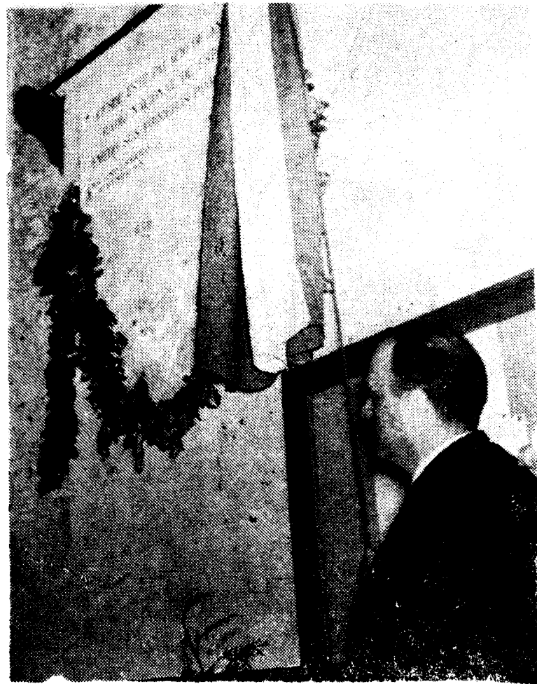
SALAMANCA.--El ministro de Información y Turismo, don Manuel Fraga Iribarne, en el acto de descubrir una placa en el Palacio de Anaya, en la que se lee: "Desde este palacio de Anaya, Radio Nacional de España transmitió sus primeros programas, XXX Aniversario de su fundación, 19 de enero de 1.967".