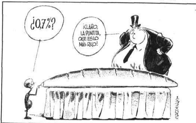
El "mejor chiste" del año. ¿Feliz Navidad? Allá cada cual con su conciencia...

cayó al piso el árbol (Mario Conde) del que hablábamos ayer aquí, sin necesidad de hacer leña del mismo ni alegrarnos del mal ajeno. En cualquier caso, me reitero en lo escrito y reconozco que sí que me alegra, aparte de la detención del presunto delincuente, el derrumbe de uno de los máximos