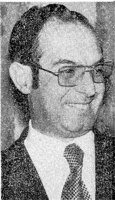
Andújar reconoce los méritos de su actual alcalde, un trabajador incansable. El lo sabe, y esto le anima a trabajar con más celo, si ello es posible.

—No tengo ninguna aptencia política y esto creo que lo tengo demos-